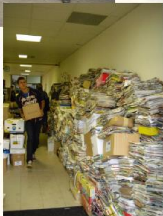
Prostor zadní chodby bývá při těchto akcích přeplněn.