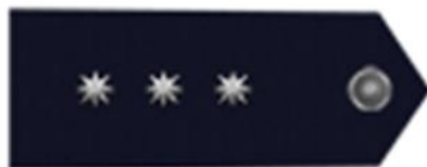
Nadstrážmistr vz. 92