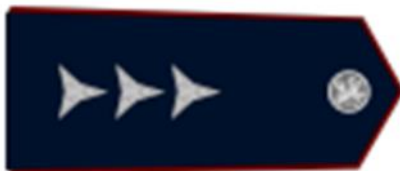
Nadstrážmistr vz. 15